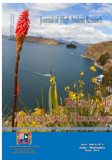
Figura 3. Vol 21n3: 2019 de publicación en línea en curso

Teniendo en consideración que la especialidad de la Revista de Investigaciones Altoandinas - Journal of High Andean Research a partir del cuarto fascículo del 2016: RIA volumen 18 número 4 (octubre a diciembre) lograda su indización de publicación, en Ciencias agropecuarias, Biológicas y Ambientales; desligándose de esta forma de la modalidad multidisciplinaria que los tenía hasta el tercer semestre del año 2016 de conformidad a las directrices de CONCYTEC Perú. Fecha para adelante se registra una tasa de rechazo en el orden de 80% con tendencia de mejora; al respecto, es oportuno esclarecer que se siguió publicando los otros temas multidisciplinarios que estaban en arbitraje y/o en el proceso de evaluación.