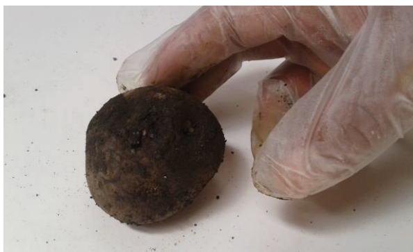
Figura 1. Tubérculo inoculado con hongo micorrizico vesiculo arbuscular MicorrizaFer® adherida con carboximetilcelulosa.

El HMVA MicorrizaFer® se pesó en el laboratorio de Aguas y Suelos de la Universidad Nacional del Altiplano Puno, según la cantidad a aplicar en los diferentes tratamientos, tabla 1.